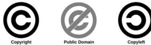
Imagen 3: derechos de autor

Vinculado con lo expresado anteriormente podemos decir que el derecho de autor es el conjunto de normas jurídicas que garantizan la propiedad intelectual -tanto patrimonial como moral- que la legislación otorga al creador de una obra de cualquier tipo (sobre la misma o parte de ella) esté ya publicada o aún permanezca como inédita. Esta legislación, también conocida con el término anglosajón copyright es relativamente moderna en Occidente (siglo XVIII) y se reconoce por el uso del símbolo ©.