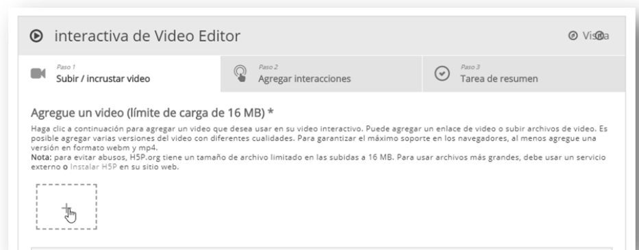
Imagen 3: Agregar el video

Inicialmente debemos incorporar el video sobre el que luego agregaremos las instancias de interacción. Si nuestro video se encuentra en el disco rígido, debemos subirlo, teniendo en cuenta que debe estar en formato mp4 y su tamaño no puede exceder los 16 Mb .