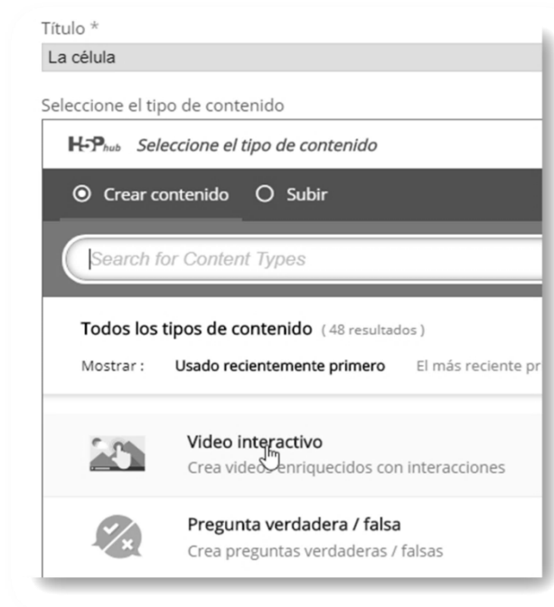
Imagen 2: Seleccionar Video interactivo

Este botón abrirá la ventana que nos permitirá crear el video. Comenzaremos colocando un título para nuestro recurso y seleccionamos el tipo de recurso desde la lista desplegable, en este caso “Video interactivo” .