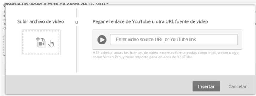
Imagen 5: Campo de inserción del enlace para videos alojados en internet

También tendremos la posibilidad de incrustar un video que ya se encuentre alojado en un sitio de internet, como YouTube. En este caso debemos completar el campo de la derecha con la URL donde se encuentre.