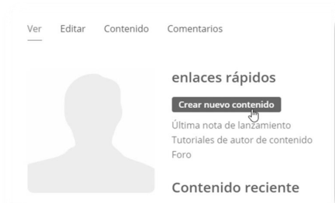
Imagen 1: Crear nuevo contenido

Esta página se presenta sólo en su versión en inglés, pero podemos traducirla de forma automática, utilizando diferentes procedimientos de acuerdo con el navegador que estemos utilizando. El primer paso es crear una cuenta, que nos permitirá acceder con nuestro nombre de usuario y contraseña. Cuando iniciamos sesión, pulsamos el botón “Mi cuenta” , situado en la parte superior derecha. Allí se nos mostrará nuestro perfil y el botón para “Crear nuevo contenido” .